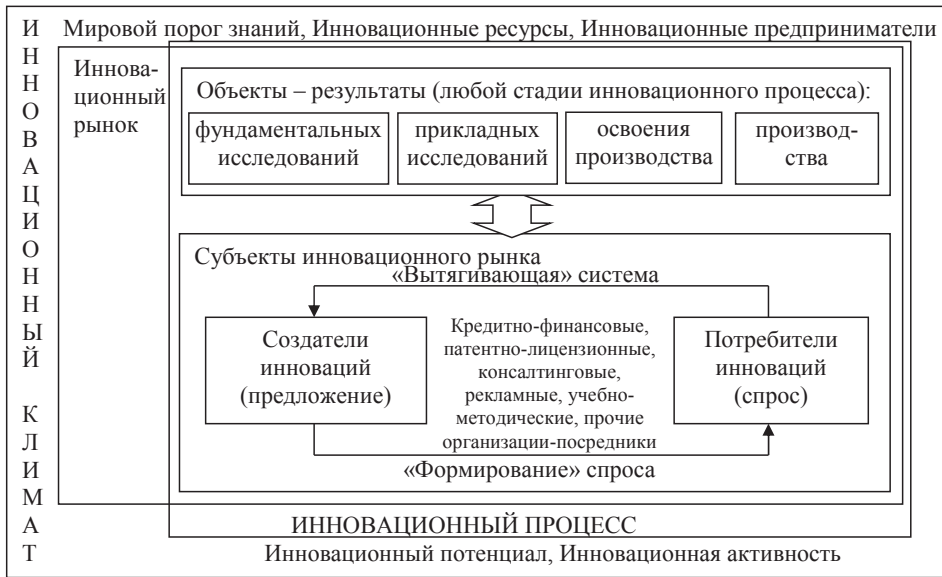
Рис. 1. Рынок инноваций: факторы внешней и внутренней среды