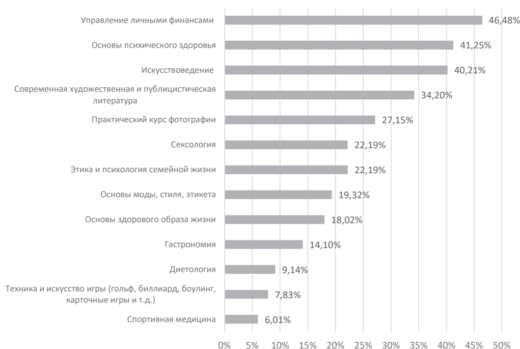
Рис. 2. Распределение ответов опрошенных выпускников на вопрос: «Какие дисциплины вне рамок учебного плана Вы бы рекомендовали студентам изучать факультативно?», %

и иных возможностей конкретного вуза. При этом включение этого компонента в учебные планы вузов, при безусловном наличии альтернативных каналов изучения соответствующих предметов (начиная с самообразования и заканчивая всякого рода программами дополнительного образования, вневузовскими тренингами и курсами и т. п.), оправдано прежде всего потому, что именно в период обучения в вузе (когда абсолютное большинство обучающихся не задумывается о целесообразности дополнительного обучения, либо не имеет для этого временных и/или финансовых возможностей), приобретение ряда непрофессиональных навыков является наиболее своевременным, отвечающим потребностям студентов / выпускников, которым предстоит заложить фундамент своей будущей деятельности в первые же годы после выпуска, когда цена разнообразных ошибок может быть довольно высока.